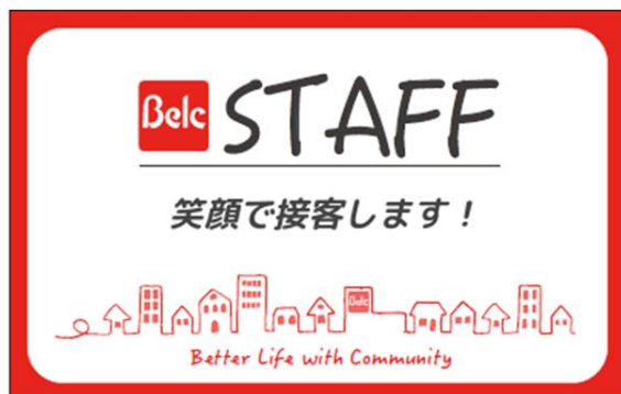
【表面】店内接客時の名札

また、従業員同士のコミュニケーションの観点から、名札の裏面には名前を表示し、バックヤードでの作業時や休憩時においては、名札を反転して使用しています。