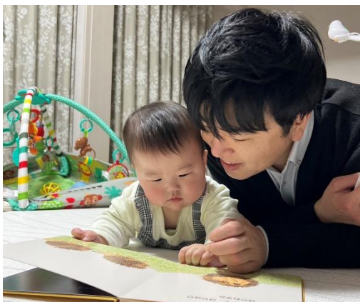
育休取得社員の様子

https://www.mhlw.go.jp/toukei/list/dl/71-r04/07.pdf