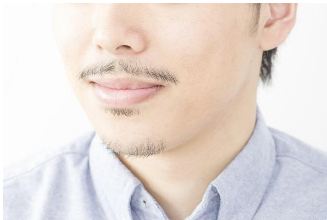
従業員の髭（ひげ）の基準（イメージ）