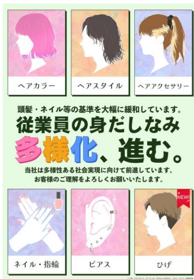
ベルク店内掲示のポスター

ベルクでは髭も個性の一つと捉えており、今後も「身だしなみの前提条件」を守りながら、必要な範囲で基準緩和を進めていきます。