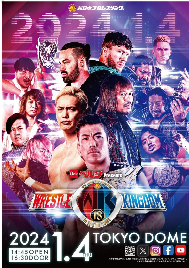
『ベルク Presents WRESTLE KINGDOM 18 in 東京ドーム』ベルク限定仕様オリジナルポスター