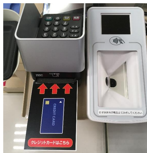
「クレジットカード挿入」例